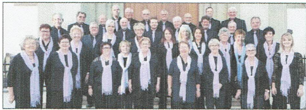
L'ambiance de Noël est prolongée avec l'ensemble vocal Haley.

L'entrée sera libre et les dons (plateau) seront destinés à la chapelle de Heiligenbrunn. La chapelle a été construite sur un ancien lieu de culte païen qui disposait d'une source aux vertus guérisseuses. D'après la chronique, la chapelle a déjà été visitée par des pè-